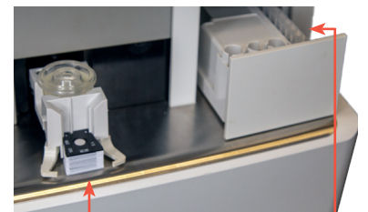
Analizador bioquímico Catalyst Dx™